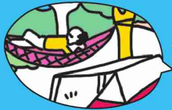
趣味を楽しみながら～